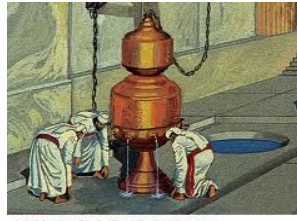
Artist's depiction of the 2nd Temple Ben Kattin laver in use. The laver was located to the south of the Sanctuary entrance.