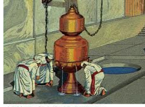
Artist's depiction of the 2nd Temple Ben Kattin laver in use. The laver was located to the south of the Sanctuary entrance.